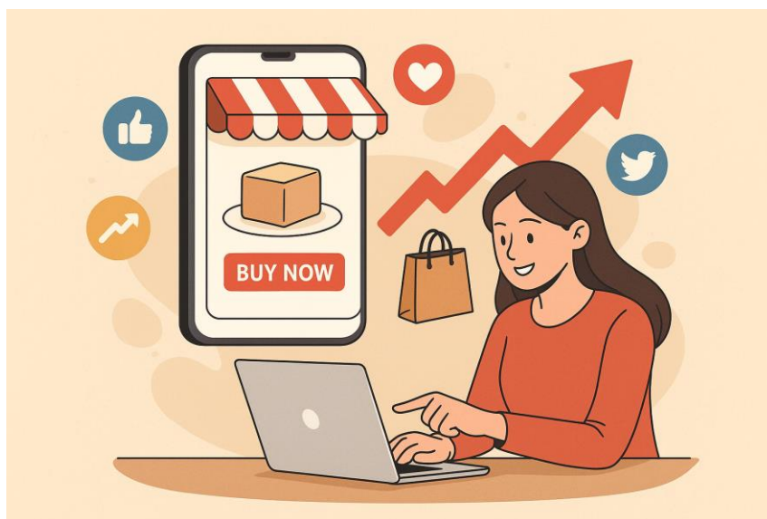
Gambar. 3 Peluang Pemasaran Digital terhadap Penjualan UMKM

Tak hanya itu, teknologi digital juga memberikan UMKM akses yang lebih baik terhadap data pasar dan perilaku konsumen melalui analitik digital. Dengan informasi yang lebih mendalam tentang preferensi konsumen, UMKM dapat beradaptasi lebih cepat terhadap perubahan kebutuhan pasar dan menciptakan produk yang lebih relevan dan sesuai dengan permintaan. Akses yang mudah terhadap informasi ini juga memungkinkan UMKM untuk menyesuaikan strategi pemasaran mereka dengan lebih tepat sasaran. Karena pelanggan sekarang cenderung mencari ulasan sebelum membeli, keberadaan testimoni dan analitik digital sangat penting untuk menjaga daya saing dan relevansi produk di pasar yang semakin dinamis.