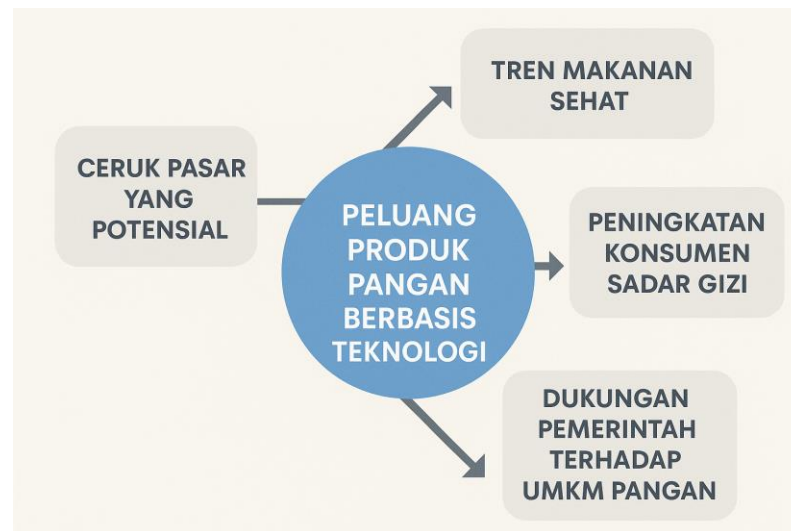
Gambar 1. Peluang Pasar Produk Sehat bagi UMKM Pangan

Salah satunya adalah penggunaan mikroalga dalam produk pangan juga memberikan peluang besar. Mikroalga seperti spirulina telah terbukti memiliki kandungan gizi yang sangat baik, termasuk protein tinggi dan asam lemak esensial (Sari & Fitriani, 2023). Teknologi yang dapat memanfaatkan mikroalga dalam produk pangan lokal memberikan keuntungan dalam meningkatkan kualitas gizi dan daya saing produk tersebut di pasar global.